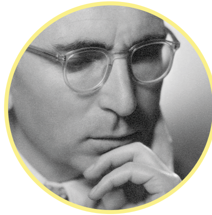
Viktor Frankl - Créateur de l'AEL